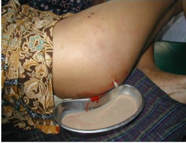
(ခ) သက်တန့်နာ